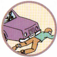
НАЕЗД НА ПЕШЕХОДА