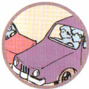
СТОЛКНОВЕНИЕ ТРАНСПОРТНЫХ СРЕДСТВ